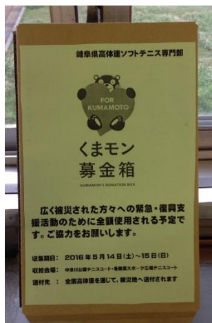
会場に設置された募金箱