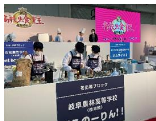
第16回全国高校生食育王選手権大会 優秀賞

[内容]食に関する知識、調理技術や実践している食育活動などについて競うことを通じて「食を選択する力」を身に付け、食育活動の実践を促進することを目的とした大会