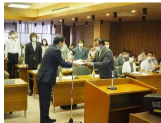
産業教育功労者表彰