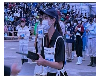
第12回全国和牛能力共進会 和牛審査競技 優秀賞

[内容]食に関する知識、調理技術や実践している食育活動などについて競うことを通じて「食を選択する力」を身に付け、食育活動の実践を促進することを目的とした大会