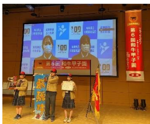
第6回和牛甲子園 総合評価部門 最優秀賞