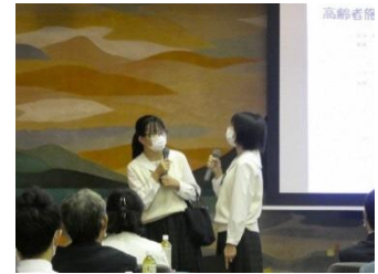
生徒によるプレゼンテーション発表