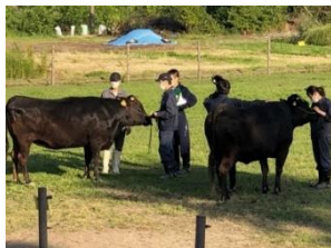
動物科学科(飛騨牛の飼育管理)