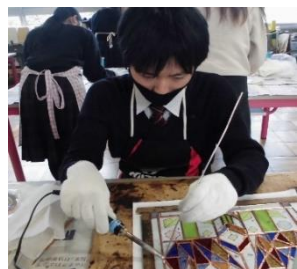
生活福祉科(スタンドグラス実習)